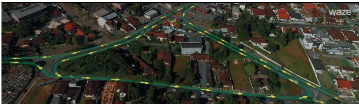
Figura 4 - Implementação da obra na rotatória que contempla as ruas Ottokar Doerffel, Marajó e Marquês de Olinda.

Por consequência, o município também obteve um retorno de R$ 7.652.251,72 em produtividade/ano. Esse cálculo é o produto de três fatores: 1. a diminuição do tempo nos congestionamentos, 2. a quantidade de pessoas que trafegam nos horários de maior movimento, como no começo do período da manhã e final do período da tarde e 3. valor da hora/trabalho dos cidadãos de acordo com o salário médio de Joinville (Prefeitura de Joinville, 2019).