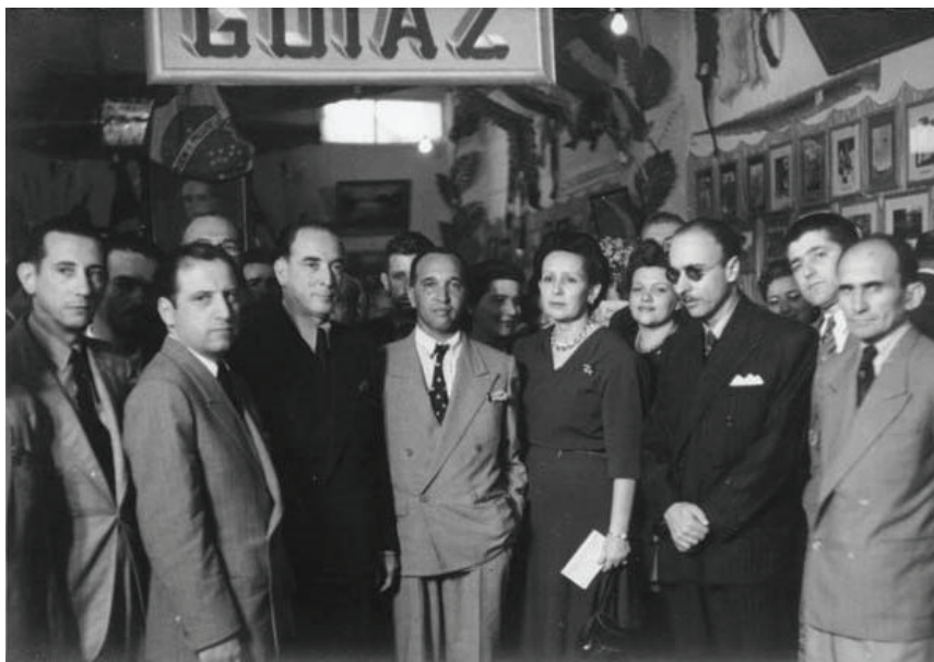
Figura 2: Fotografia do Museu do Estado, c.1946.