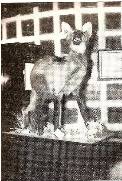
Figura 4: Fotografia de Lobo Guará empalhado – Goiás, s/d

de possíveis interessados nos recursos naturais da região. Ele, inclusive, trabalhou na constituição de um mapa geológico em Goiás, em que apresentava a distribuição de minérios, cuja finalidade era a exposição museológica, mas também, atrair investimentos externos para Goiás. Conforme a documentação apresentada no ofício citado, os objetos destinados ao Museu evidenciam tanto o interesse na apresentação de registros de história natural (figura 4), como satisfazer aos interessados na exploração dos recursos minerais (figuras 5 e 6).