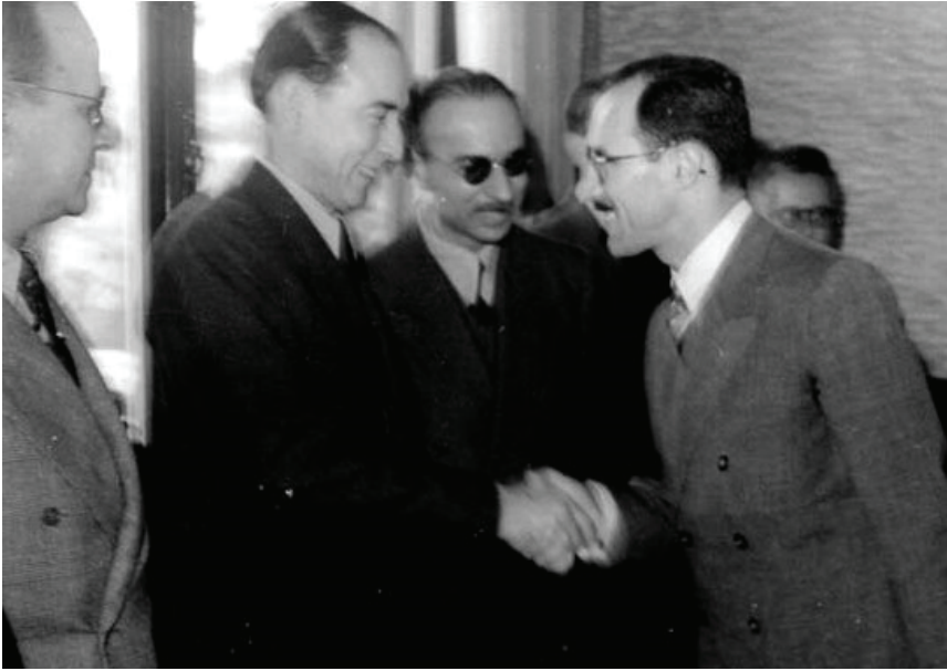
Figura 1: cerimônia do Batismo Cultural, apresentação do engenheiro Fábio de Macedo Soares Guimarães a Pedro Ludovico Teixeira, Interventor Goiás (com Mário Augusto Teixeira de Freitas ao lado)