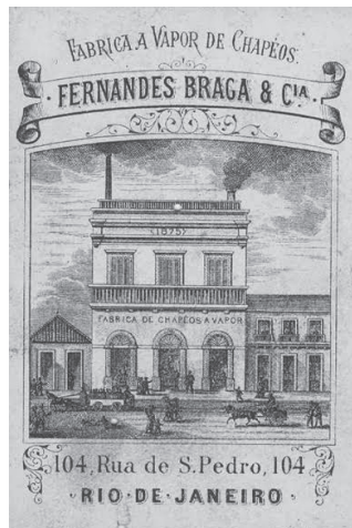
Figura 2 – Propaganda da Fábrica em 1875 50

A propaganda da própria fábrica enfatizava a modernidade do empreendimento e do processo de fabricação do chapéu com tecnologia, eficiência e rapidez.