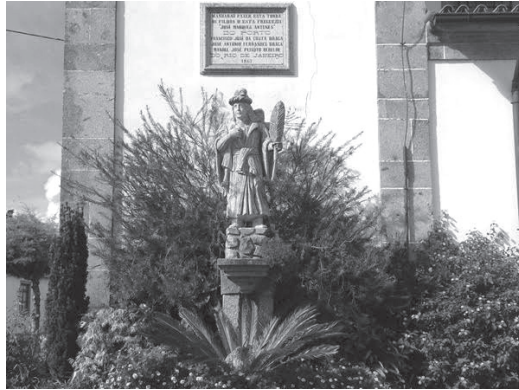
Figura 1 - Torre da Igreja em Sam Paio de Merelim 30

A referência aos nomes relacionados ao Rio de Janeiro demonstra a conexão que havia com a cidade Braga, tanto na vinda como nos retornos numa outra condição de vida superior àquela quando emigraram. O envio de recursos ganhos no Brasil para as famílias bracaraenses era algo regular, havendo registros de negociações, procurações, hipotecas, heranças e investimentos presentes nos testamentos e nas escrituras. Além disso, não poucas construções de casas e de igrejas ocorreram com os recursos enviados do Brasil, sendo a arquitetura das casas influenciada pela cultura abasileirada desses retornados. 31