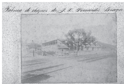
Figura 4 - Construção da Fábrica na Mangueira 58

Os prédios, as mercadorias, as matérias primas e as máquinas estavam avaliados em mais de mil contos de réis. Os seguros de diversas companhias - Fidelidade, Integridade e Geral de Seguros, União Commercial de Varegistas, Atalaya, Previdente - no valor de setecentos a oitocentos mil réis, garantiram a retomada da produção e a continuidade com a indenização. Eis a razão para o esforço de salvar os livros contábeis com os registros financeiros e de estoques. Entretanto, nem tudo foi consumido pelo fogo permitindo a circulação de mercadorias durante os anos de reconstrução em outro local. 55 A fábrica funcionou provisoriamente na mesma Rua de S. Pedro, 56 e, em meados do ano seguinte, José Luiz partiu para a Europa, no vapor Thames , para adquirir maquinário e matérias primas para a nova unidade. 57