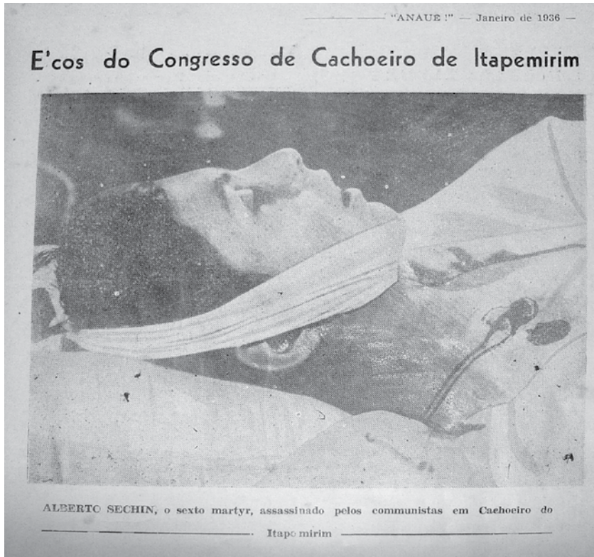
Imagem 1: Revista Anauê , Ano II, n 6, p.1, jan. 1936.

Vê-se também um grande número de policiais que estavam mobilizados para apaziguar o conflito. Na sequência da reportagem, outra imagem apresenta cena que, possivelmente, foi captada durante a troca de tiros. Na foto, aparecem muitos integralistas correndo desesperadamente, outros se protegendo atrás de postes e alguns caídos na praça. 37