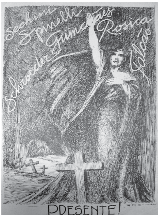
Imagem 2: Revista Anauê , Ano II, n.6, p.36, jan. 1936.

Apesar de ser apenas um desenho, a intenção da publicação era evidente: transmitir a idéia de perenidade apesar da morte. Não faltaram oportunidades para a imprensa da AIB reproduzir imagens impressionantes. O assassinato do militante capixaba Alberto Sechin, por exemplo, em 1935, ocupou um espaço de destaque na galeria de imagens fúnebres dos seguidores de Plínio Salgado. 39