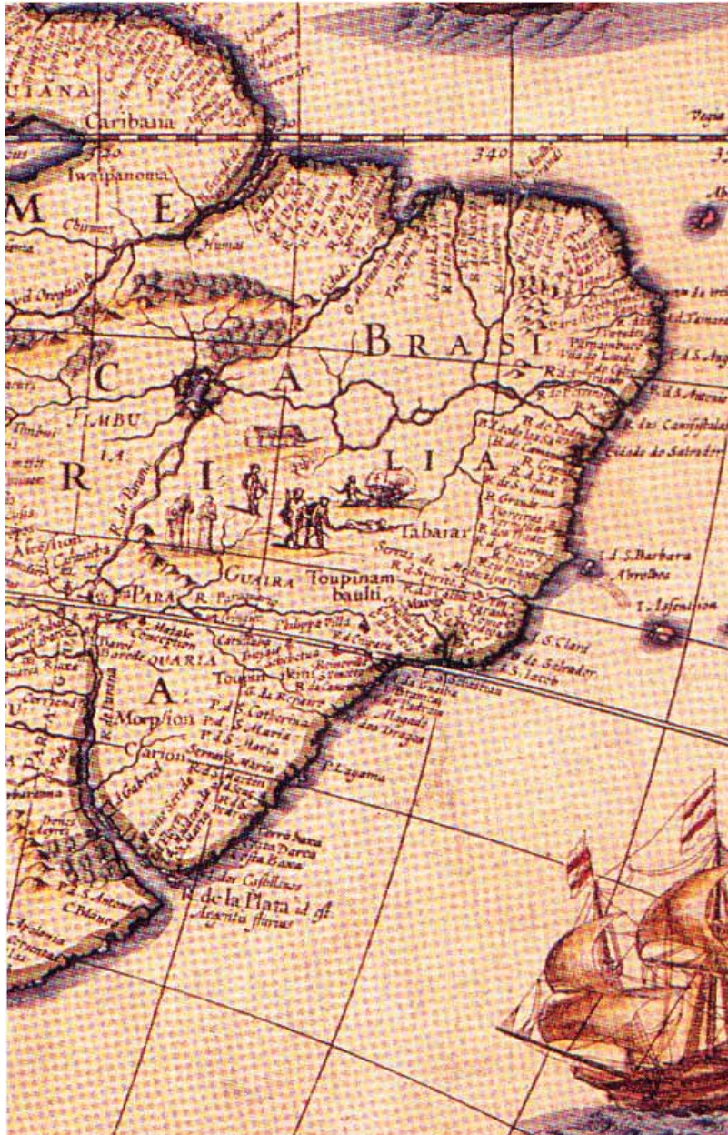
Imagem 2 Willem Blaeu, America Nova Tabula , 1642