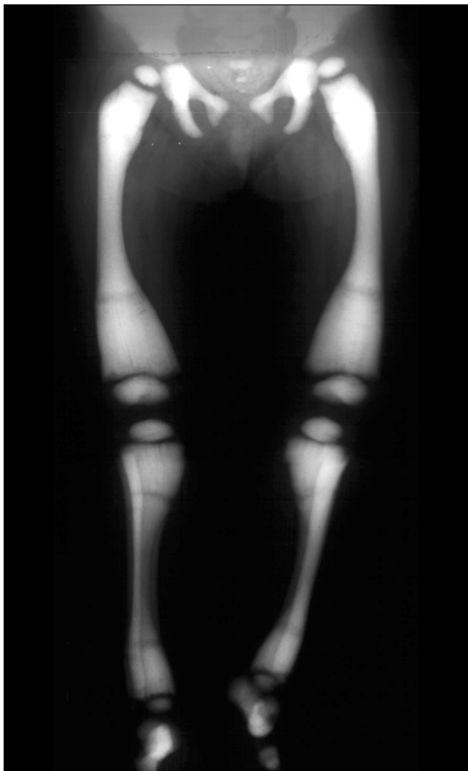
Figura 3 - Metáfises distais e proximais das tíbias e dos fêmures alargadas com aumento da densidade óssea

alguns casos (9) . Esta evidência pode ser comprovada pela melhora da função visual e neurológica observada em certos pacientes após o transplante de medula óssea (9) .