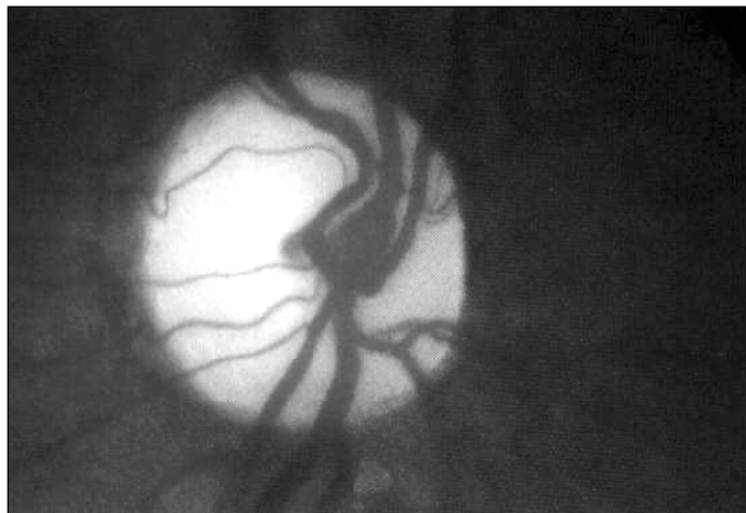
Figura 1 - Papila atrófica

Segundo Ainsworth e col. (7) , seria apropriado investigar