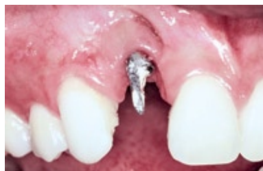
FIGURA 1 - Aspecto clínico evidenciando a diferença em altura da margem gengival.