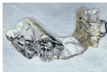
FIGURA 6 - Aparelho ortopédico. Vista anterior.

com auxílio de trefina, enxerto ósseo autógeno em bloco e posterior colocação de outro implante ou osteotomia segmentar, associada ou não à osteodistração, para reposicionamento coronal do implante e confecção de nova coroa. Após avaliação dos riscos e benefícios das duas técnicas, optou-se pelo reposicionamento do implante. Devido à necessidade de mobilização coronal do implante superior a 4mm e ao fato da mucosa palatina não apresentar elasticidade suficiente para permitir este deslocamento imediato, seria confeccionado um aparelho que possibilitasse esse deslocamento de forma gradativa (osteodistração). Inicialmente foram confeccionados modelos em gesso dos arcos dentais e, após montagem em articulador semi-ajustável, foi feita a cirurgia em modelo para mensurar a magnitude do movimento. Como o deslo-