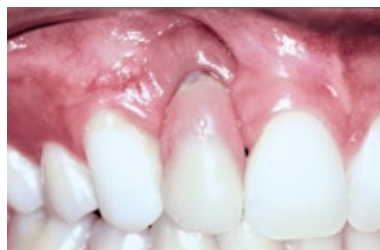
FIGURA 2 - Aspecto estético insatisfatório da gengiva artificial.