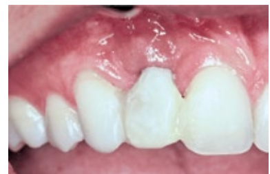
FIGURA 12 - Aspecto clínico da coroa provisória após o término das ativações do distrator.