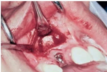
FIGURA 7 - Osteotomias verticais completadas.

e foi feita a colagem de um braquete sobre a face vestibular da coroa do dente 12, posicionado imediatamente abaixo da alça do aparelho ortopédico (Fig. 10). A paciente foi medicada com antibiótico (amoxicilina, 500mg, v.o., 8/8 hs.) por um período de 5 dias e analgésico (paracetamol, 750mg, v.o.) em caso de dor. Após um período de latência de 7 dias a ativação foi iniciada com a frequência 2/4 de volta uma vez ao dia (0,5mm) durante 12 dias. Após cada ativação a coroa era fixada às coroas dos dentes adjacentes com auxílio de resina composta foto-ativada para evitar mobilidade do segmento e o excesso da coroa era removido por desgaste na borda incisal (Fig. 11). Após este período observou-se que margem gengival do dente 12 estava posicionada de forma estética quando comparada à margem gengival dos dentes adjacentes e interromperam-se as ativações (Fig. 12). A coroa foi então fixada aos dentes adjacentes e após 60 dias o splint foi removido para confecção da restauração definitiva. Após 1 ano da realização do procedimento observa-se que tanto o periodonto de proteção quanto o de sustentação apresentam-se