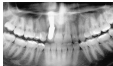
FIGURA 3 - Radiografia panorâmica mostrando o posicionamento do implante.