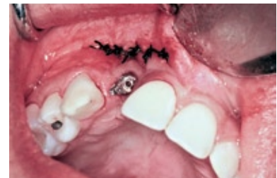
FIGURA 9 - Sutura através de pontos interrompidos.