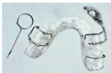
FIGURA 5 - Aparelho ortopédico. Vista inferior.