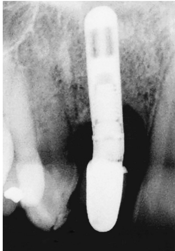
FIGURA 14 - Aspecto radiográfico de normalidade após um ano do procedimento.

A remoção de um implante endo-ósseo pode ser efetuada com uma broca trefina de dimensão apropriada. Entretanto, esta manobra requer espaço suficiente em volta do implante e geralmente resulta em defeitos ósseos e de tecidos moles