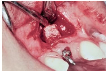
FIGURA 8 - Segmento ósseo mobilizado.