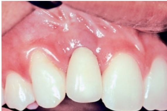
FIGURA 13 - Aspecto clínico de normalidade após um ano do procedimento.

dentro dos aspectos clínicos e radiológicos de normalidade (Fig. 13, 14).