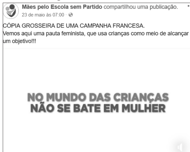
Imagem 2 – Post da Página Mães Pelo Escola Sem Partido no Facebook