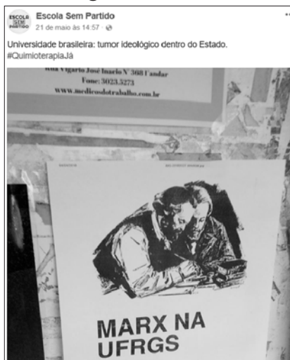
Imagem 1 – Post da Página Escola Sem Partido no Facebook

Fonte: página do Facebook Escola sem Partido (2018).