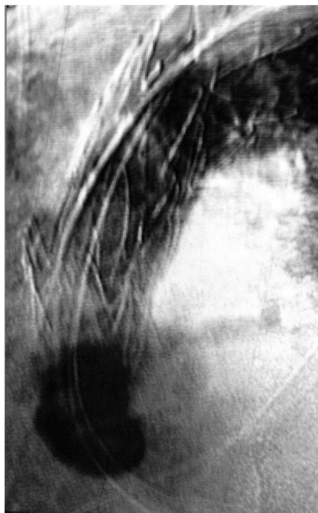
Fig. 2 – Guia rígida posicionada dentro do ventrículo esquerdo