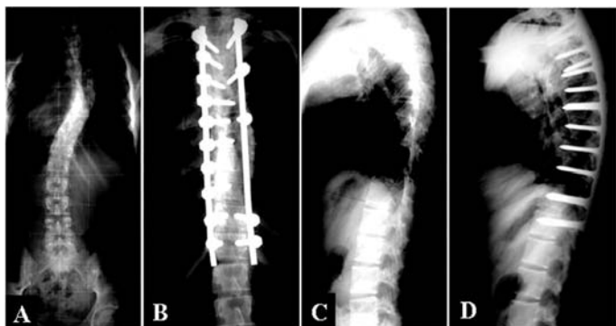
Figura 1 – Imagens radiográficas pré-operatórias (A e C) e pós-operatórias (B e D) de paciente submetido à instrumentação anterior.

Um sistema de parafuso com encaixe lateral (USS Synthes®) foi utilizado para a correção anterior ou posterior com o uso exclusivo de parafusos monoaxiais e hastes de 6mm de diâmetro (Figuras 1 e 2).